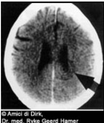
© Amici di Dirk, Dr. med. Ryke Geerd Hamer

Dieren beleven deze biologische conflictschokken op een letterlijke manier. Zij lijden bijvoorbeeld een conflict door een plotseling verlies van het nest of territorium, het verlies van een jong, de scheiding van een partner of van de kudde, de onverwachte dreiging te verhongeren of een doodsangst. Omdat in de loop van de tijd de menselijke geest een figuurlijke manier van denken heeft ontwikkeld, kunnen wij deze biologische conflicten ook in overdrachtelijke zin ervaren. Een man kan bijvoorbeeld een 'territoriumverlies conflict' lijden als hij onverwachts zijn huis of zijn werkplek verliest. Een vrouwelijk 'nestconflict' kan de bezorgdheid zijn over het welzijn van een van de leden van het 'nest', een 'verlatingsconflict' kan worden getriggerd door een onverwachte scheiding of een plotselinge ziekenhuisopname. Kinderen kunnen een 'scheidingsconflict' lijden als mamma besluit weer te gaan werken of als de ouders uit elkaar gaan.