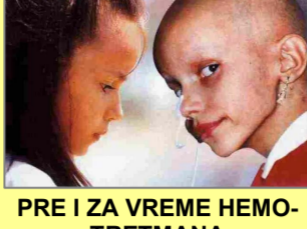
PRE I ZA VREME HEMOTRETMANA

„Prodavanje hemoterapije kao ‘terapije’ je verovatno najveća prevara u istoriji medicine. Ko god upravlja ovom hemo-torturom, zaslužuje spomenik u paklu.”