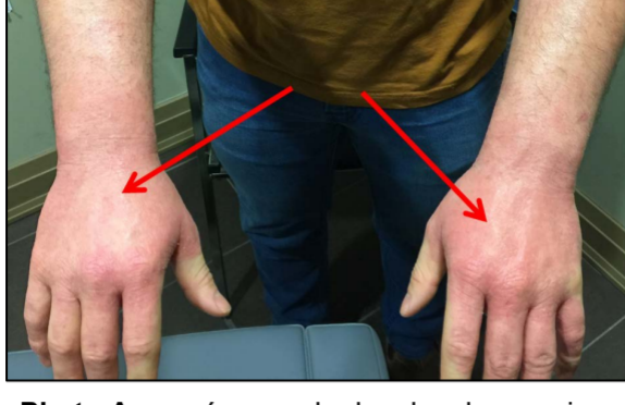
Photo A : eczéma sur le dos des deux mains. Première consultation.

Le patient est revenu au cabinet près de cinq mois plus tard pour un autre problème. Il a dit avoir quitté son emploi quelques semaines après la dernière consultation et que ses symptômes cutanés se sont améliorés presque immédiatement (voir la photo B). Il estimait que l'éruption cutanée avait complètement disparu et souhaitait consacrer du temps au traitement d'autres conflits à l'origine d'autres symptômes.