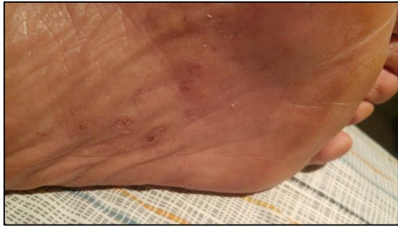
Photo A : « dyshidrose » au pied gauche. Photo prise quelques semaines avant la première consultation.