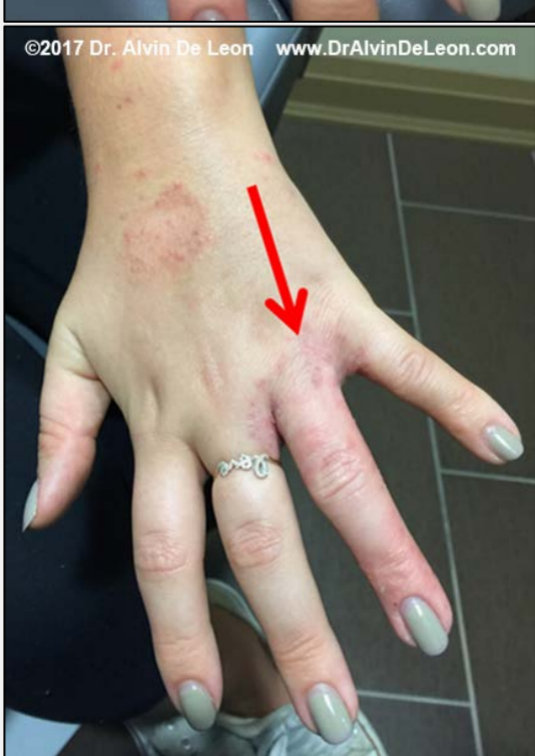
Photo B : éruption cutanée aux mains lors de la première consultation