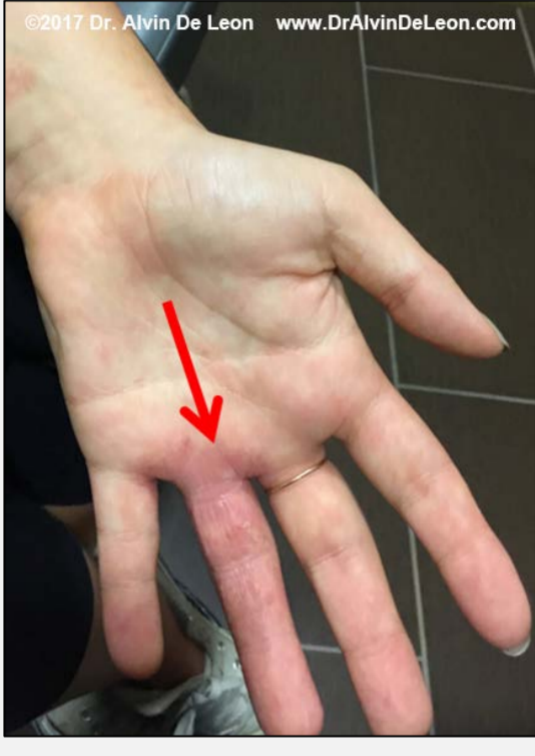
Photo A : éruption cutanée aux mains lors de la première consultation