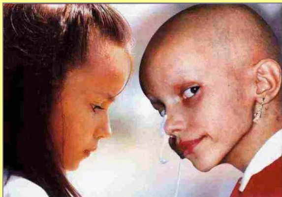
VOOR EN TIJDENS DE CHEMO-BEHANDELING

“Chemotherapie te verkopen als een ‘therapie’ is met alle waarschijnlijkheid het grootste bedrog in de geschiedenis van de geneeskunde. Degene die deze chemo-tortuur heeft bedacht verdient een standbeeld in de hel.”