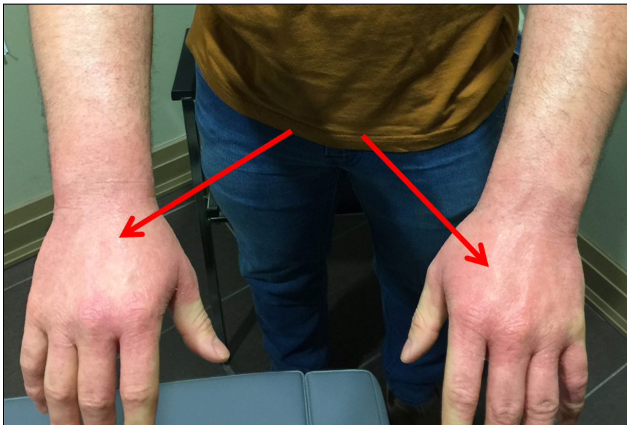
Fotografija A: Ekcem na obe nadlanice. Prva poseta

Skoro 5 meseci kasnije, klijent je ponovo došao na kliniku, opet zbog drugih tegoba. Dao je otkaz, nekoliko nedelja posle poslednje kontrole, i njegovi simptomi su skoro momentalno nestali (vidi fotografiju B). Njegov osip na koži nadlanica se 100% poboljšao, i sada je želeo da prodiskutujemo o drugim konfliktima koji su doveli do drugih simptoma.