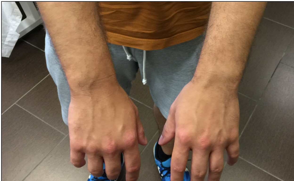
Fotografija B: 5 meseci kasnije

Za pojašnjenje specifičnih termina, pogledajte dokument „Pet Bioloških Zakona”