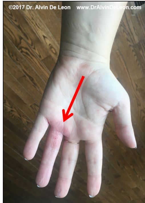
Fotografija C: Fotografije koje je poslao pacijent 5 dana kasnije