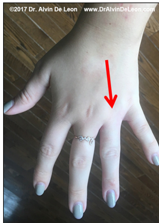
Fotografija D: Fotografije koje je poslao pacijent 5 dana kasnije

Za pojašnjenje specifičnih termina, pogledajte dokument „Pet Bioloških Zakona”