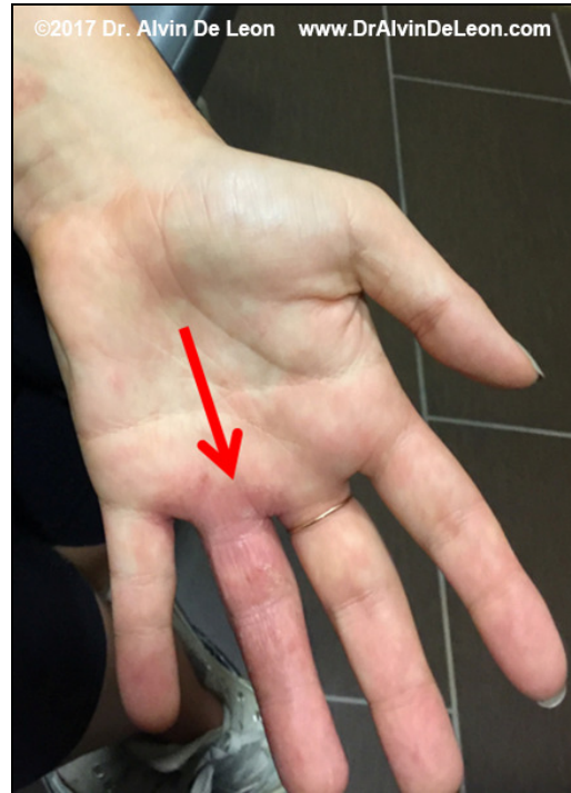
Fotografija A: Osip na ruci tokom prve posete