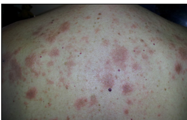
FOTOGRAFIJA 3: Kontrola, 2 nedelje kasnije