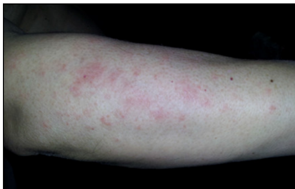
FOTOGRAFIJA 2: Prva poseta (desna podlaktica)