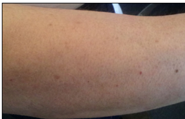
FOTOGRAFIJA 6: Druga kontrola, 3 meseca posle prve posete

Za pojašnjenje specifičnih termina, pogledajte dokument „Pet Bioloških Zakona”