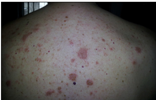
FOTOGRAFIJA 1: Prva poseta (gornji deo leđa)