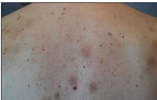
FOTOGRAFIJA 5: Druga kontrola, 3 meseca posle prve posete