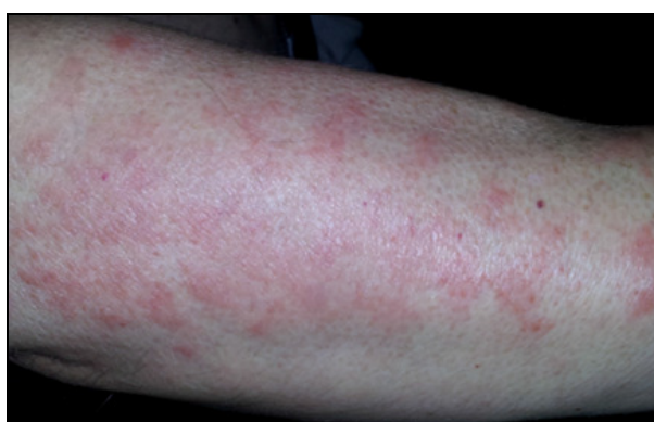
FOTOGRAFIJA 4: Kontrola, 2 nedelje kasnije